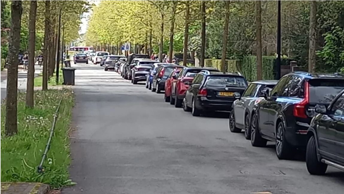
Parkeeroverlast Verlengde Slotlaan

het Programma Luchtruimvoorziening wordt duidelijk dat deze afziet van de vierde aanvliegeroute. Ongetwijfeld zal de weerstand van 24 gemeenten, de provincies Utrecht en Gelderland hebben bijgedragen aan het besluit. En natuurlijk ook de bijna 83.000 ondertekenaars van de petitie en de talloze uitgevoerde acties.