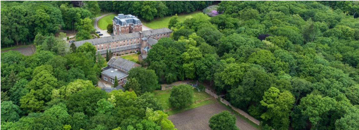
Landgoed Dijnselburg aan de Wegh der Weegen (Amersfoortseweg)