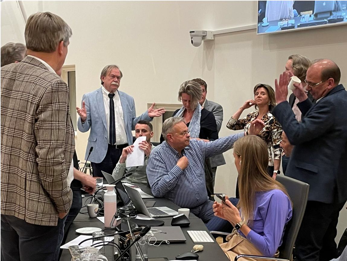
Overleg met raad over burgeramendement op 23 mei 2023