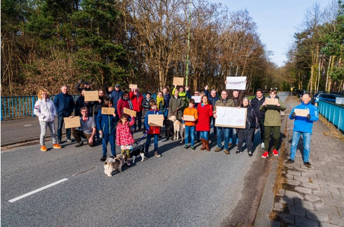
protest tegen afsluiting Huis ter Heideweg 2023