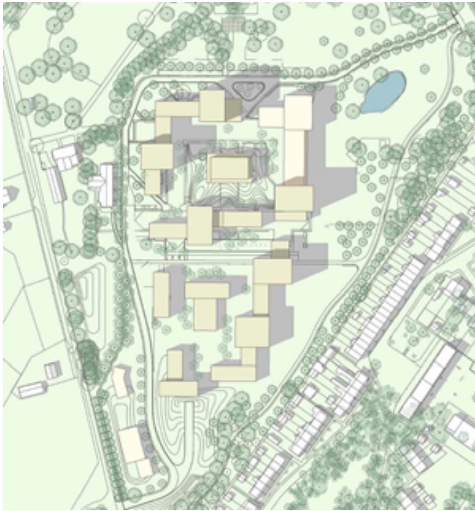
PGGM-terrein: voorbeeldverkaveling met hoogte-accenten van 30 - 45 meter

Bouwen en Wonen: planontwikkeling door evenwichtig afwegen van belangen