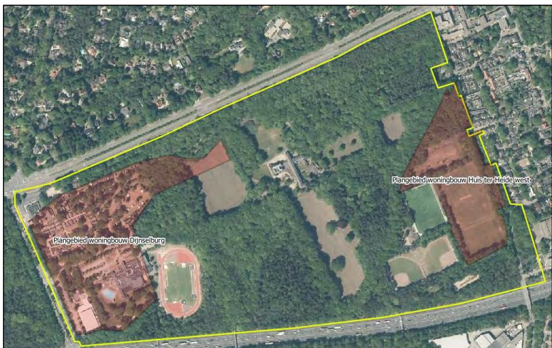
Figuur 1.1 Overzicht van de plangebieden (rode contouren) en het onderzoeksgebied (gele contouren).

Gemeente Zeist is voornemens om woningen te realiseren op het landgoed Dijnselburg en in het westen van Huis ter Heide (zie figuur 1.1). In het kader van eerder uitgevoerd ecologisch onderzoek zijn de betreffende plangebieden onderzocht op aanwezigheid van dassen (Fairhurst, 2019; Fairhurst & Schrader, 2020; Jansen & Heinen, 2022; Peeters & Hoksberg, 2020; Schrader, 2018). Eco-groen heeft op 17 januari 2023 een soortgericht veldbezoek uitgevoerd waarbij het landgoed Dijnselburg en het plangebied ten westen van Huis te Heide op sporen van dassen zijn onderzocht. Uit dit onderzoek is gebleken dat op het terrein van het landgoed meerdere bewoonde verblijfplaatsen van dassen aanwezig zijn en dat de voorgenomen ontwikkelingen mogelijk van invloed kunnen zijn op de functionaliteit van deze verblijfplaatsen.