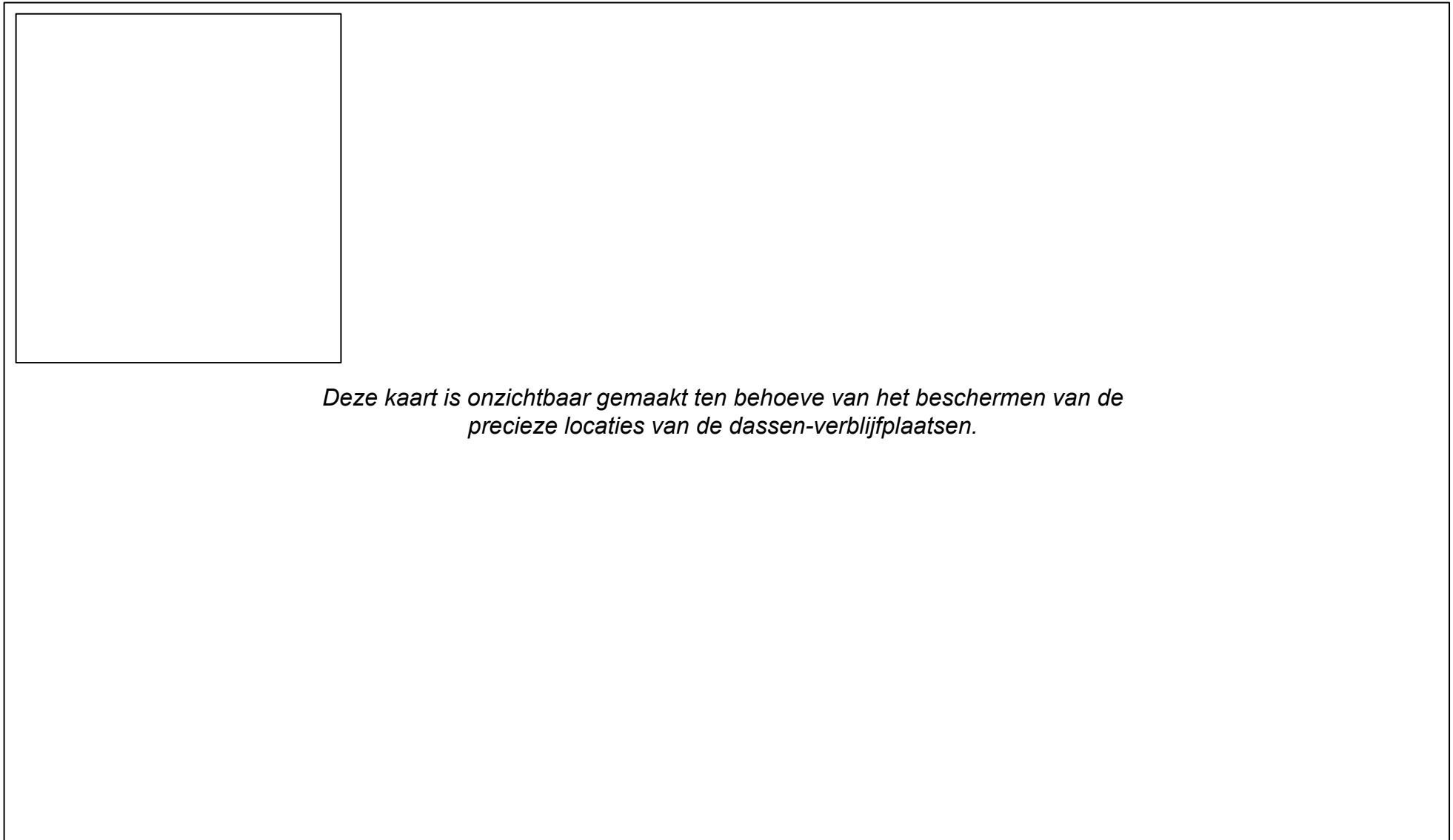
Figuur B2: Overzicht van de gebieden waar tijdens het veldonderzoek foerageersporen van dassen zijn aangetroffen.