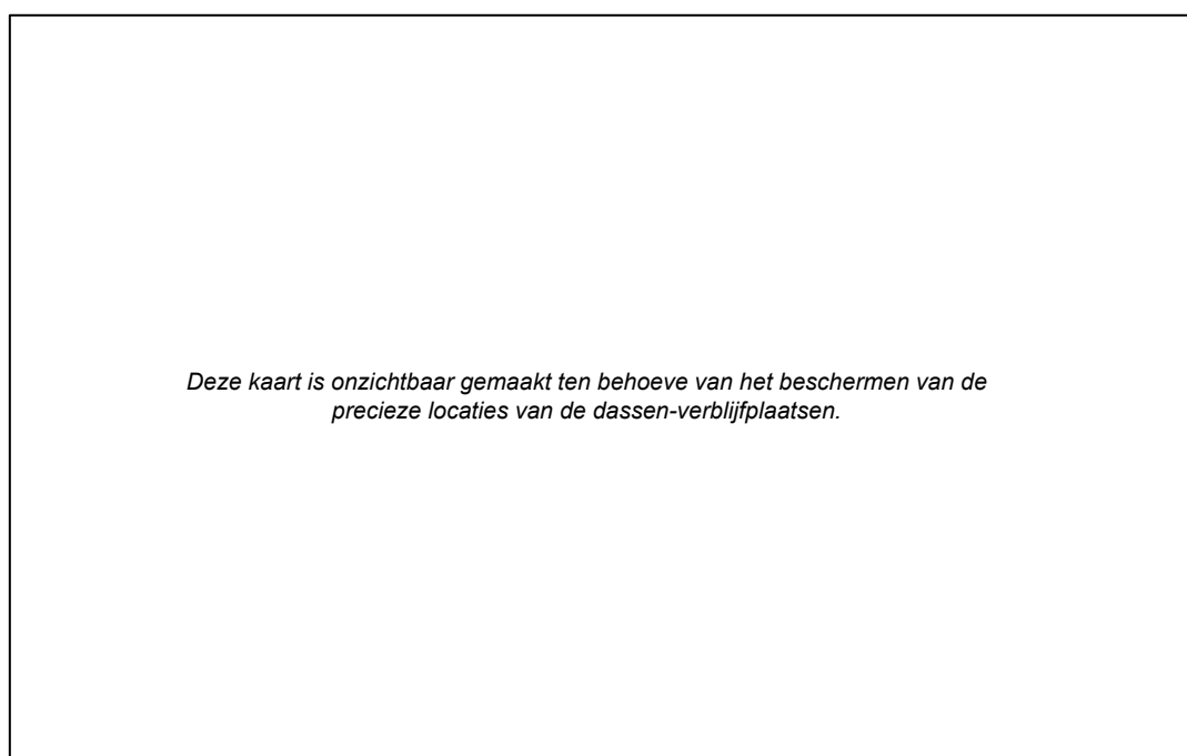
Figuur 3.3 Verblijfplaatsen van dassen (gele punten) binnen het onderzoeksgebied.

Op het terrein van landgoed Dijnselburg bevinden zich meerdere verblijfplaatsen van dassen. Het gaat hierbij om een grote hoofdburcht, drie bijburchten en een vluchtpijp. Voor een locatieoverzicht van de verblijfplaatsen zie figuur 3.3.