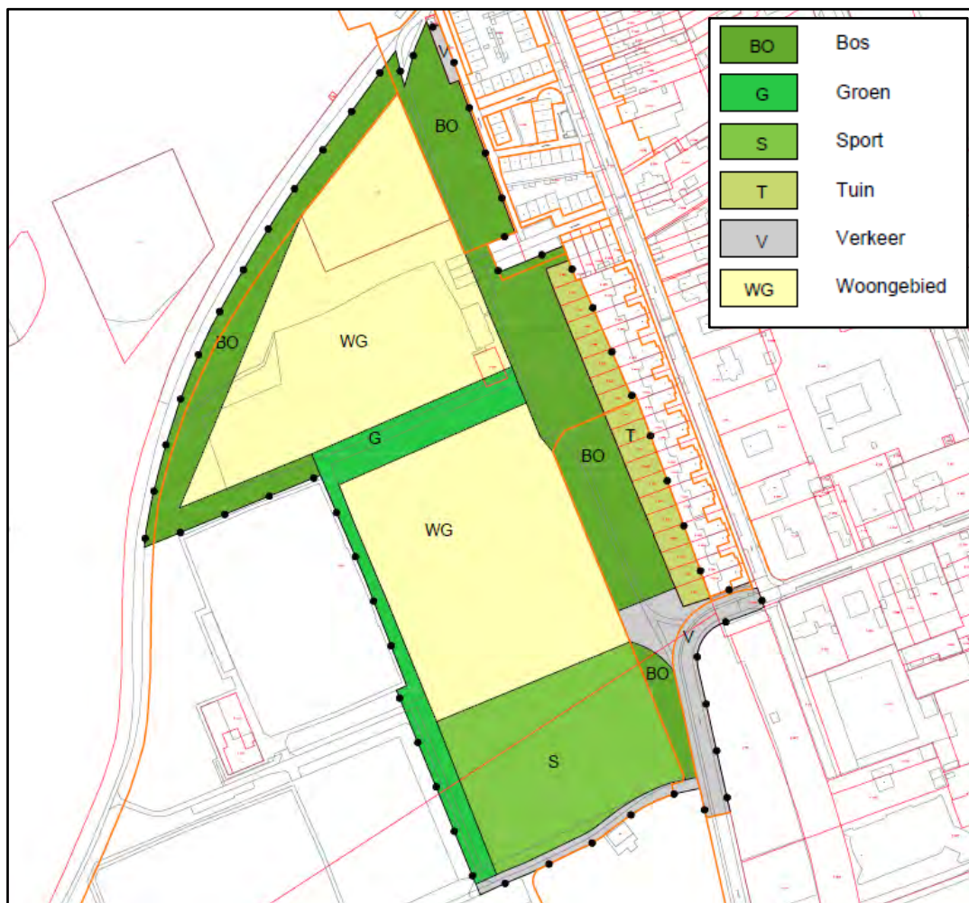
Figuur 1.3 Plangebied woningbouw Huis ter Heide west (omkaderd met zwarte stippen) en geplande inrichting.