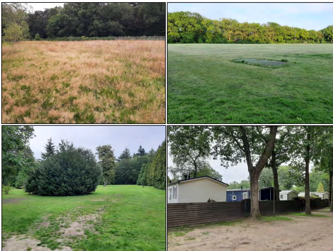
Figuur 1.2 Impressie van de huidige situatie in de plangebieden ‘woningbouw Huis ter Heide west’ (boven) en ‘woningbouw Dijnselburg’ (onder).

De gemeente Zeist is voornemens om in de twee plangebieden woningbouw te realiseren. Daarnaast liggen er plannen voor een herinrichting van het landgoed Dijnselburg die in de gebiedsvisie Dijnselburg zijn uitgewerkt (BRO, 2022). Hieronder worden de voorgenomen ontwikkelingen per plangebied kort omschreven.