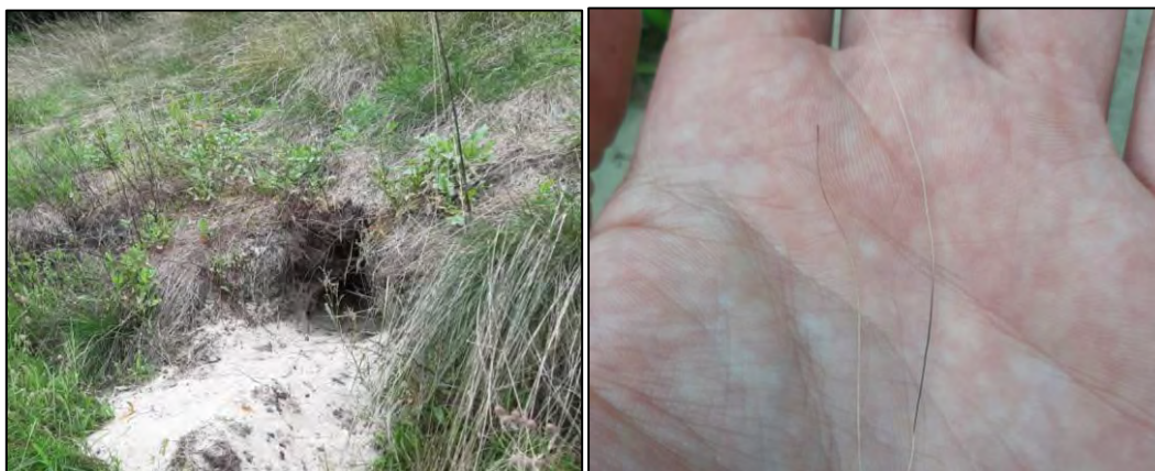
Figuur 3.8 Foto's van de vluchtpijp en dassenharen die voor de ingang van deze verblijfplaats aangetroffen zijn.