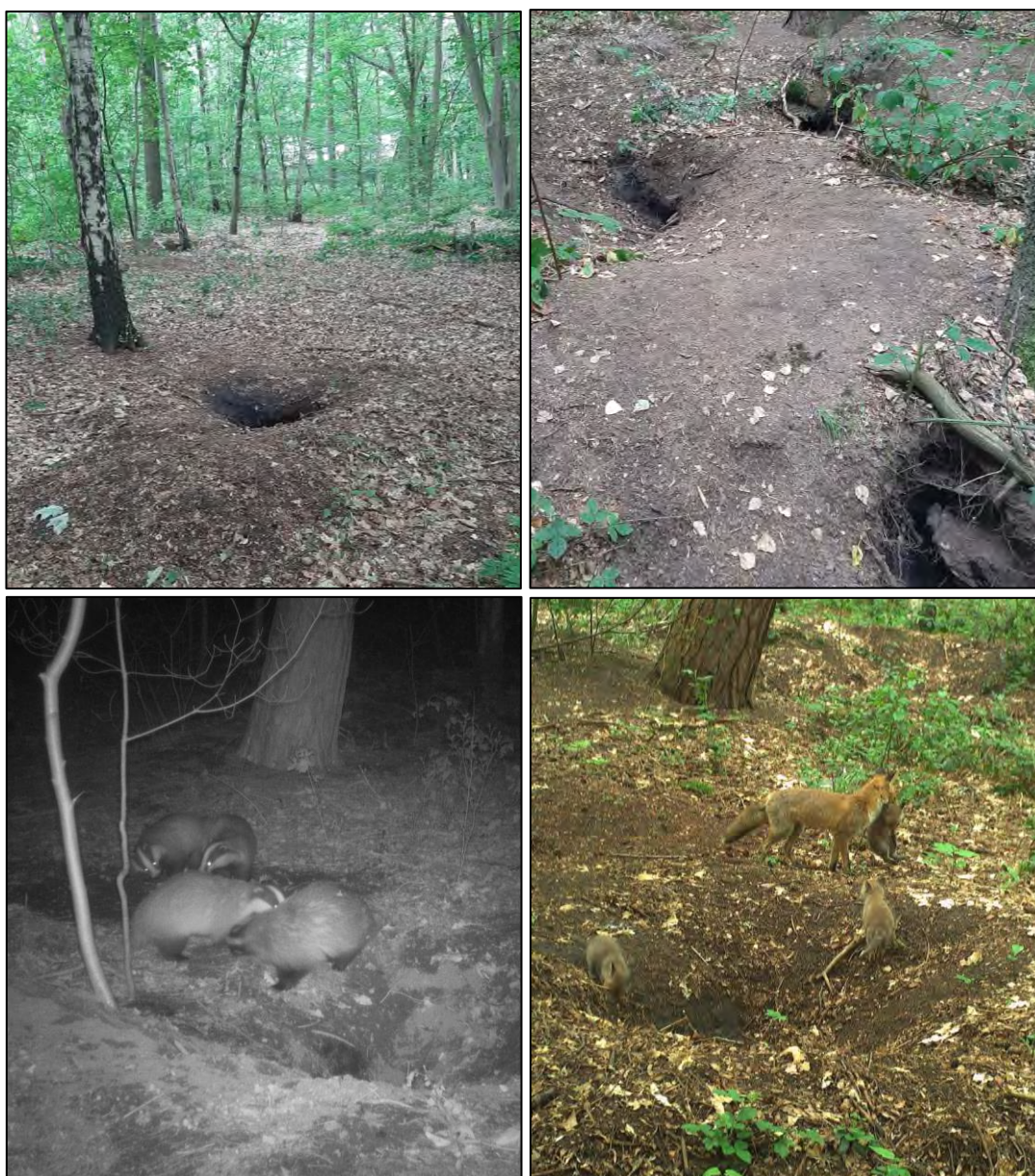
Figuur 3.4 Foto's van de hoofdburcht, de dassenclan en de vossenfamilie die de verblijfplaats tijdens de onderzoeksperiode gebruikten.