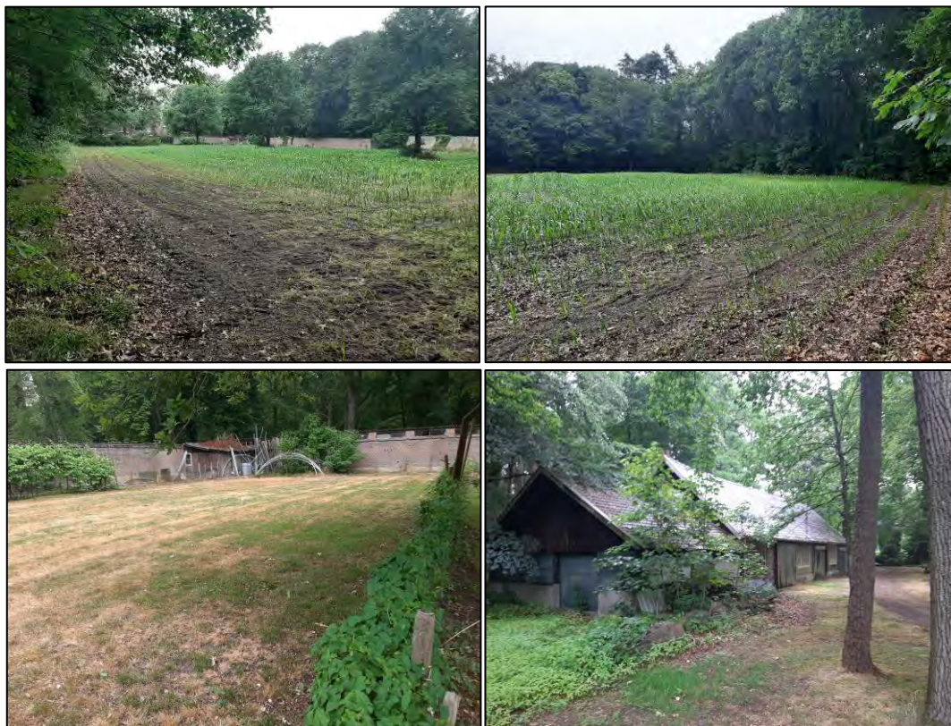
Figuur 3.9 Impressie van de foerageergebieden in de directe omgeving van de hoofdburcht. De twee maïsakkers ten noorden en noordoosten van de burcht (boven in beeld) en de grasvelden ten oosten van het landhuis en rondom de schuren van het landhuis (onder in beeld).

Naast de directe omgeving van de hoofdburcht wordt met name de maïsakker ten westen van het Percuris College als foerageergebied gebruikt. Ook de randen van de akker en het gazon ten oosten hiervan worden intensief gebruikt (zie figuur 3.10). Met name tegen het einde van de onderzoeksperiode (augustus 2023) werden tijdens het sporenonderzoek opvallend veel foerageersporen in de randen van de maïsakker aangetroffen. Door de vochtige nazomer en een combinatie van luchtige grond met een rijke strooisellaag en kort gras aan de randen van de maïsakker is het voor de dassen makkelijk om in dit terrein aan regenwormen te komen. Ook de aanwezigheid van twee bijburchten en een vluchtpijp in dit gedeelte van het onderzoeksgebied duidt erop dat dit terrein belangrijk foerageergebied voor de dassen vormt. Voor een overzicht van de hierboven beschreven essentiële onderdelen van het foerageergebied wordt verwezen naar bijlage 1. Op basis van het uitgevoerde onderzoek wordt verwacht dat in periodes van langdurige droogte of vorst ook foerageergebieden buiten de hierboven beschreven terreinen essentiële functies voor de plaatselijke dassenclan vervullen.