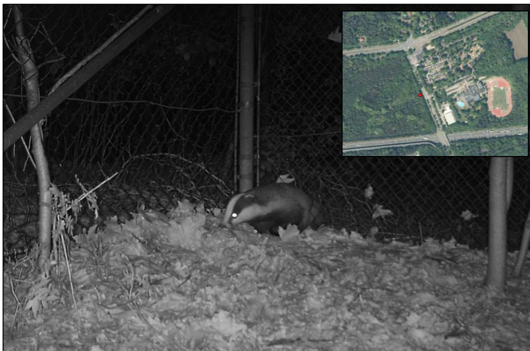
Figuur 3.2 Foto van een das die vanaf het landgoed Vollenhoven door het gat in het hek kruipt. De uitsnede geeft de locatie van de opening in het hek weer (rode punt).

Tijdens het sporenonderzoek zijn in het zuidwestelijke gedeelte van het onderzoeksgebied wissels aangetroffen die erop wijzen dat de dassen van de clan-Dijnselburg de Panweg ten westen van het onderzoeksgebied oversteken. Aan de westzijde van de Panweg ligt een bebost gebied dat onderdeel uitmaakt van het Landgoed Vollenhoven. Dit stuk bos is aan de westzijde van de Panweg omheind. Tijdens de inspectie van dit hek is een opening aangetroffen die een voor dassen geschikte doorgang biedt. Bij de opening is vervolgens een wildcamera geplaatst (zie figuur 2.2 en 3.2). De camera heeft op meerdere momenten dassen vastgelegd die vanaf het landgoed Vollenhoven door het gat kruipen en op latere tijdstippen weer terugkomen (zie figuur 3.2). Op basis van deze waarnemingen wordt geconcludeerd dat op het landgoed Vollenhoven een andere dassenclan actief is en dat de Panweg het territorium van de clan-Dijnselburg ten westen begrenst. Ook de vondst van een (grens)latrine aan de westzijde van de Panweg (buiten het hek) bevestigt deze verwachting.