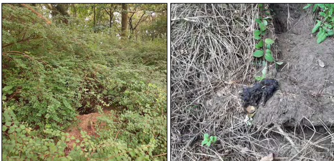
Figuur 3.6 Foto's van bijnacht 2 en dassenuitwerpselen in de directe omgeving van de verblijfplaats.

Deze verblijfplaats bevindt zich aan de noordwestkant van de maïsakker ten westen van het Percuris college. De verblijfplaats ligt binnen de grenzen van het plangebied 'woningbouw Dijnselburg' en op een afstand van circa 520 meter van het plangebied 'woningbouw Huis ter Heide west'. Deze maïsakker ligt enkele meters lager dan het omliggende terrein. De dassen hebben de bijnacht in het talud aan de rand van de akker gegraven. Het betreft een bijnacht met één enkele ingang die omgeven is door dichte struweelbegroeiing. Tijdens het verkennende veldbezoek in januari 2023 zijn bij deze verblijfplaats geen recente bewoningssporen aangetroffen. Ook zijn bij de uitgevoerde avondbezoeken in mei en juni 2023 geen dassen bij deze verblijfplaats aangetroffen. Tijdens het sporenonderzoek in augustus 2023 zijn echter wel bewoningssporen in de vorm van verse uitwerpselen en prenten van dassen bij de ingang en in de directe omgeving van de bijnacht aangetroffen. Voor een impressie zie figuur 3.6.