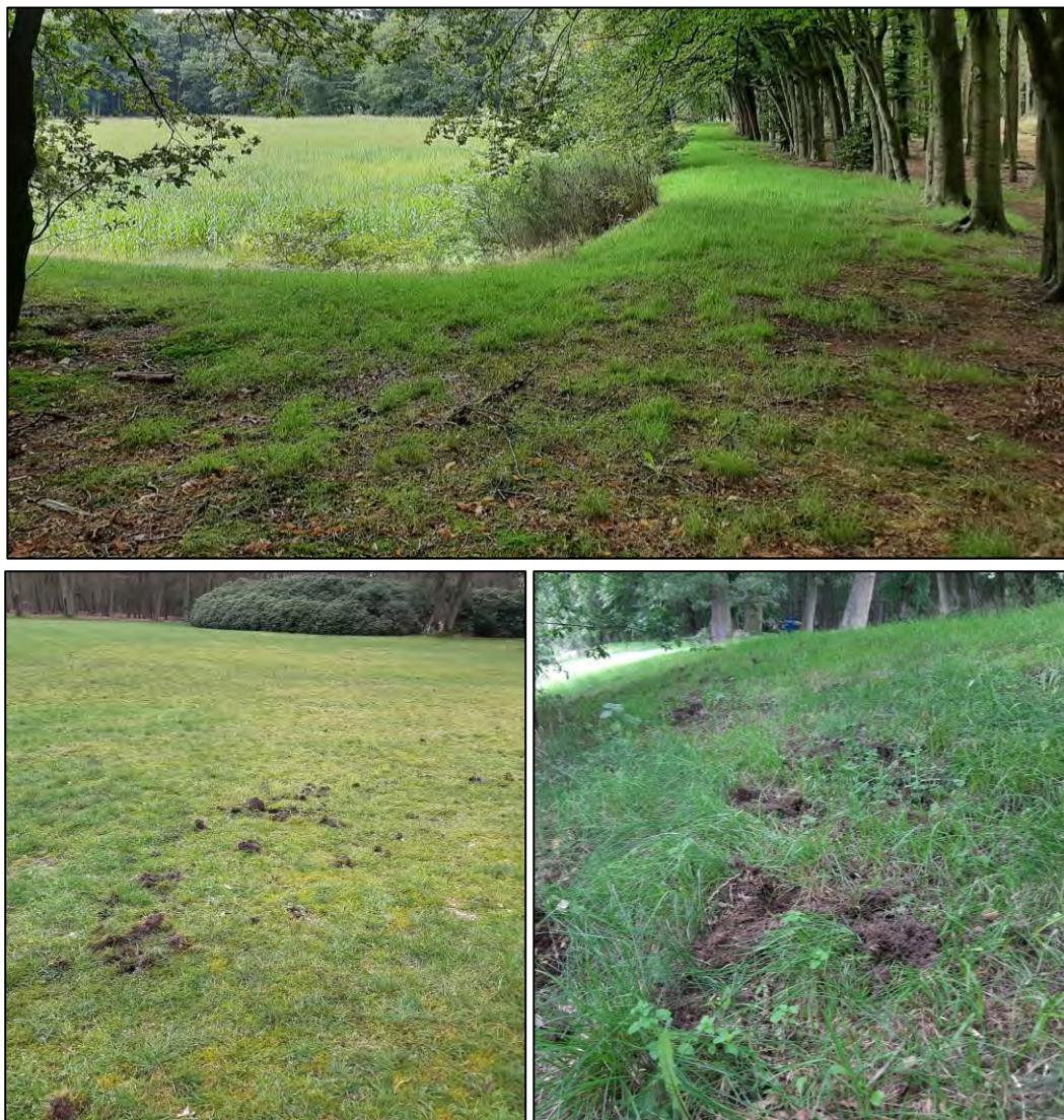
Figuur 3.10 Impressie van het foerageergebied rondom de maïsakker ten westen van het Percuris College (boven in beeld). Typische foerageersporen van dassen aan de randen van de akker (rechtsonder in beeld) en op het gazon ten oosten van de akker (linksonder in beeld).

Naast de hierboven beschreven foerageergebieden lopen de dassen ook naar andere gebieden in de omgeving om voedsel te zoeken. Tijdens het onderzoek zijn foerageersporen op alle grasvelden binnen het onderzoeksgebied aangetroffen, met uitzondering van het kunstgrasveld en het baseballveld ten zuiden van de hoofdburcht. Verder wordt in bebost gebied langs de randen van de tuinen in het noordoostelijke gedeelte- en langs de A28 en de westzijde van de Panweg in het zuidwestelijke gedeelte van het onderzoeksgebied gefoerageerd. Naar verwachting vinden de dassen hier minder voedsel dan op de grasvelden mits deze vochtig zijn. In periodes van droogte of vorst vormen juist de beboste gedeeltes weer belangrijk foerageergebied omdat de grond hier minder snel uitdroogt of bevriest en er een grotere variatie aan voedsel te vinden is.