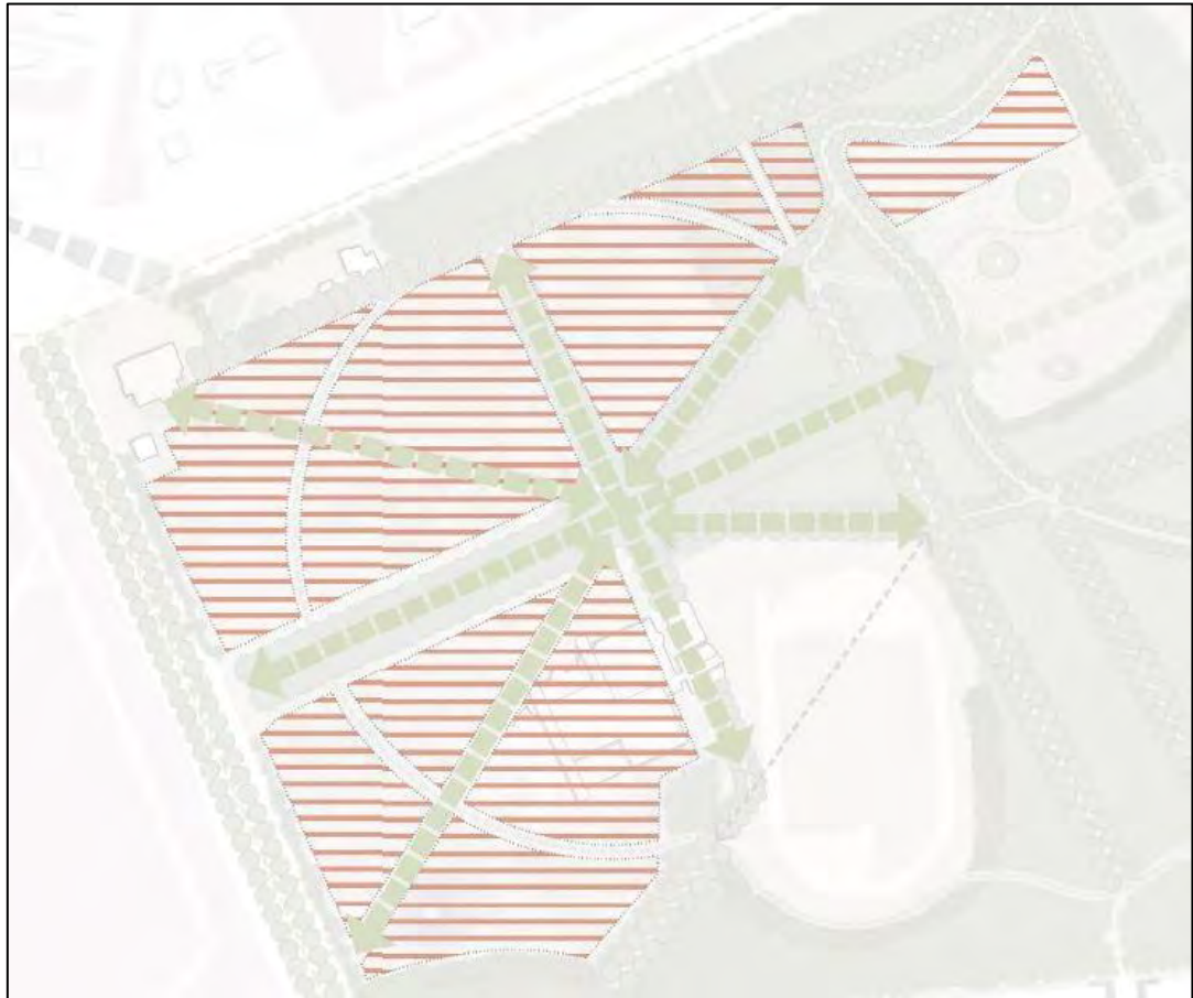
Figuur 1.4 Aangewezen ontwikkelvelden voor woningbouw/ herinrichting en locatie van ontsluitingspaden in het westelijke gedeelte van het landgoed Dijnselburg.