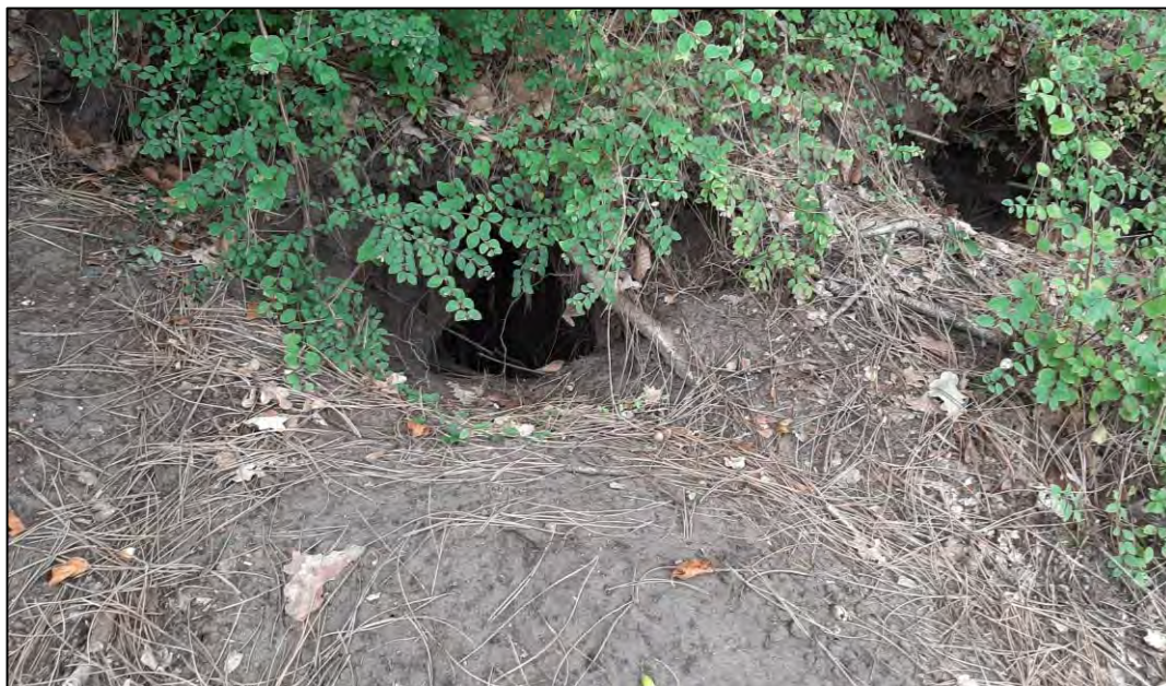
Figuur 3.7 Foto van bijburcht 3.

Deze verblijfplaats bevindt zich op circa 30 meter afstand ten noordoosten van bijburcht 2 in het talud van de maïsakker. De verblijfplaats ligt binnen de grenzen van het plangebied 'woningbouw Dijnselburg' en op een afstand van circa 500 meter van het plangebied 'woningbouw Huis ter Heide west'. Het betreft een bijburcht met twee ingangen, omgeven van dichte struweelbegroeiing. Ook bij deze verblijfplaats zijn tijdens het verkennende veldbezoek in januari 2023 geen recente bewoningsporen aangetroffen en bij de uitgevoerde avondbezoeken in mei en juni 2023 geen dassen aangetroffen. In augustus 2023 zijn tijdens het sporenonderzoek echter wel verse bewoningsporen van dassen bij de ingangen aangetroffen (zie figuur 3.7).