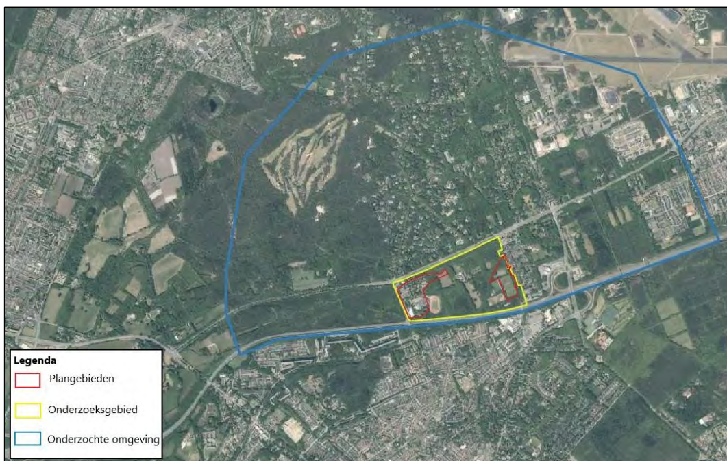
Figuur 2.1 Overzichtkaart met het onderzoeksgebied das op verschillende niveaus.