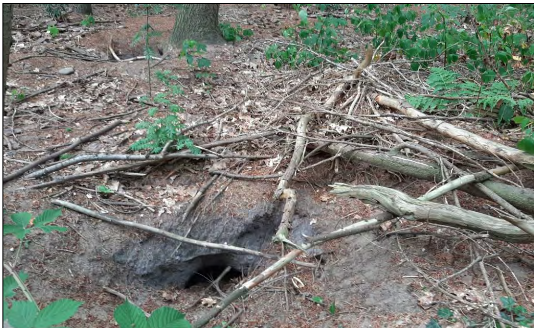
Figuur 3.5 Foto van bijnacht 1.