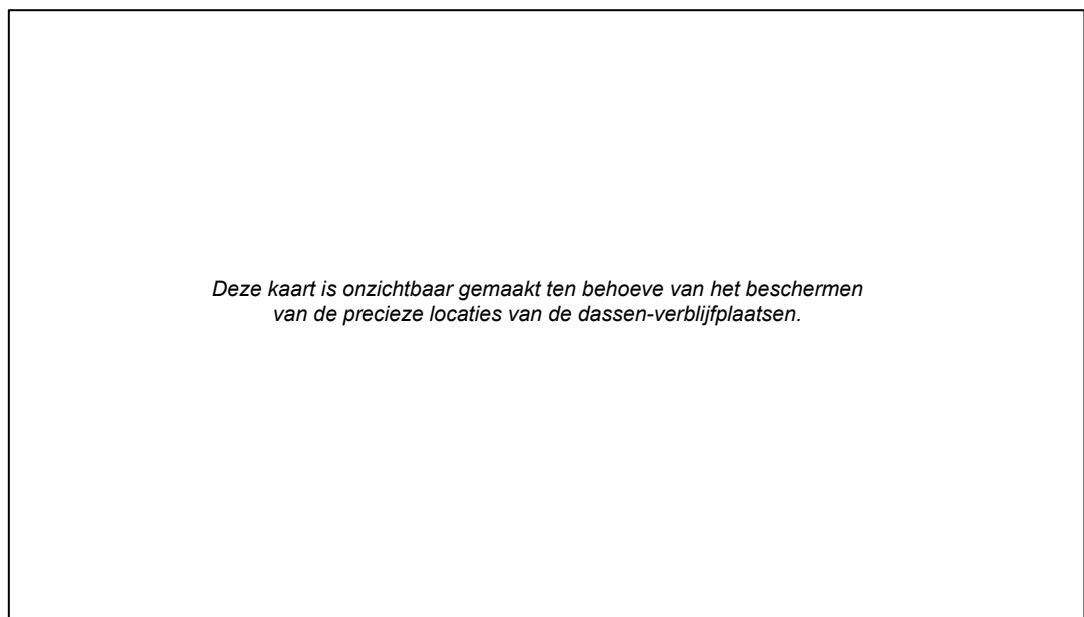
Figuur 3.1 Locatie van de (hoofd)burchten en geschatte omvang van het onderzochte dassenterritorium en de territoria in de omgeving. Bron achtergrond: PDOK.

Binnen het onderzoeksgebied is één territorium van dassen aanwezig. In de omgeving zijn hiernaast nog twee andere dassenterritoria bekend. De verblijfplaatsen van de betreffende andere dassenclans liggen ten oosten van de Zandbergenlaan in Sterrenberg en ten noorden van de Amersfoortseweg in Soesterberg (zie figuur 3.1). Deze verblijfplaatsen liggen op een afstand van circa 1100 meter (Sterrenberg) en 2200 meter (Soesterberg) ten opzichte van het onderzoeksgebied. Op basis van bekende waarnemingen in de NDFF (2023) en de dichtheid van de dassenpopulatie in de gemeente Zeist wordt hiernaast nog minstens één dassenterritorium ten noorden van het onderzoeksgebied (Bosch en Duin) verwacht.