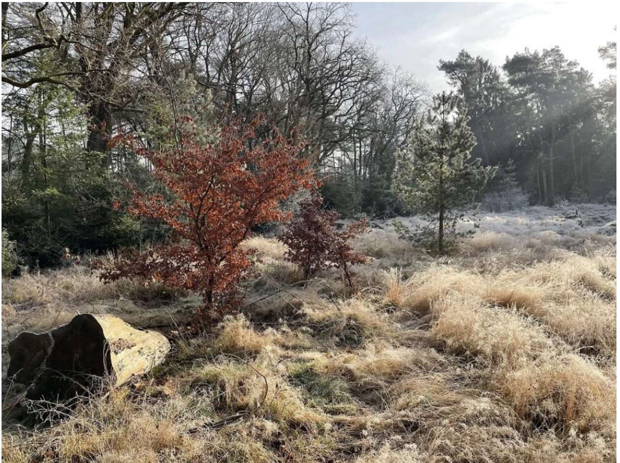
Herfst Wa Hoeve

Overigens beschermen de procedures niet automatisch bos tegen kap. Wel kunnen ontwikkelaars wachten op een onherroepelijk vonnis van de rechtbank en/of de Raad van State. Immers, als volgens de vonnissen het besluit van de gemeenteraad moeten worden aangepast of vernietigd kan alsnog tot boscompensatie worden verplicht. En dat risico zullen veel ontwikkelaars willen vermijden. Zie verder de digitale kaart met de door de raad vastgestelde aanpassingen. Open de kaart in een volledig scherm.