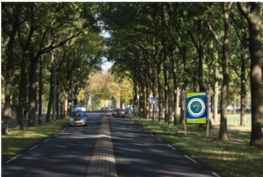
voorgesteld en afgewezen Led-scherm Koelaan

Het was de bedoeling van het college deze schermen te plaatsen langs de Utrechtseweg, Driebergseweg, Koelaan (in plaats daarvan later de Laan van Beek en Rooijen) en Boulevard. Dergelijke ontsierende schermen zijn echter helemaal niet nodig. Bovendien verstoren ze wildpassages en tasten ze het aanzien van deze cultuurhistorische wegen aan. Verder worden verkeersdeelnemers extra afgeleid met kans op ongelukken. Kortom: beter ten halve gekeerd dan ten hele gedwaald.