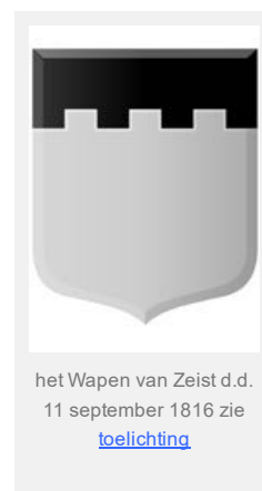
het Wapen van Zeist d.d. 11 september 1816 zie toelichting